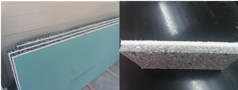
Panel Akustik Gips 33PU